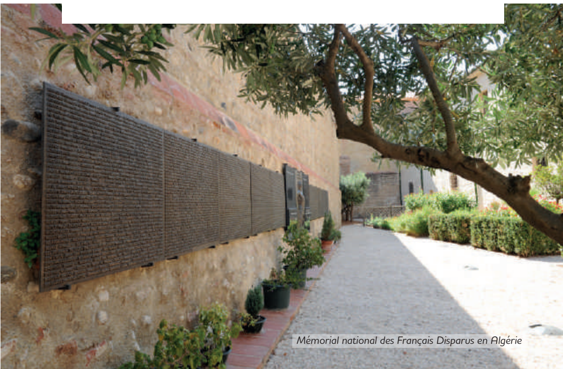
Mémorial national des Français Disparus en Algérie

Transmettre, explorer, enrichir et analyser le patrimoine matériel et immatériel des Français d'Algérie sont les maîtres-mots de l'activité du Centre qui sur plus de 1200 m 2 , est constitué de 5 pôles : Archives, Photothèque, Bibliothèque, Expositions et Mémorial national des Disparus en Algérie (1954/1963).