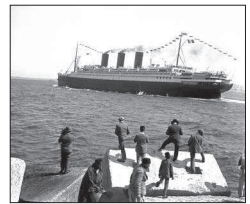
Photographies sur plaque de verre - Années 1930