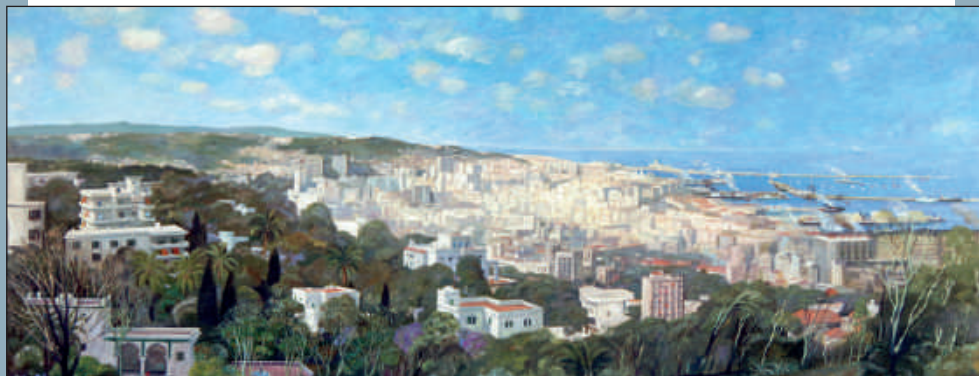
La baie d'Alger de Louis Fernex (Huile sur toile 290 x 140 cm)

Tél. 04 68 66 30 18 ou 04 68 35 51 09 ou 04 68 53 94 23