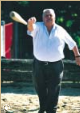
Jeu de Billon.

billon tout en faisant coller le sien ; cela nécessite des qualités d'adresse et de coup d'œil. Comme tout jeu traditionnel, il possède son vocabulaire ; ainsi les plus habiles réussissent souvent des crêpes, c'est-à-dire des coups heureux, interdits aux débutants qui brûlent, c'est-à-dire échouent le plus souvent ; plus populaire est l'expression piquer cul qui signifie faire rebondir le billon sur la pointe pour faire approcher la partie lourde. Et pour ajouter un peu de piment à la partie, il existe le billon au rateau, variante cambraisienne du billon traditionnel : il s'agit, d'une distance de 9 m, de faire entrer la partie mince du billon entre les dents d'une fourche appelée rateau. Maladroits s'abstenir ! A Salesches, une étape intermédiaire consiste à insérer les billons entre trois poteaux. Bref au billon, laissons place aux professionnels !