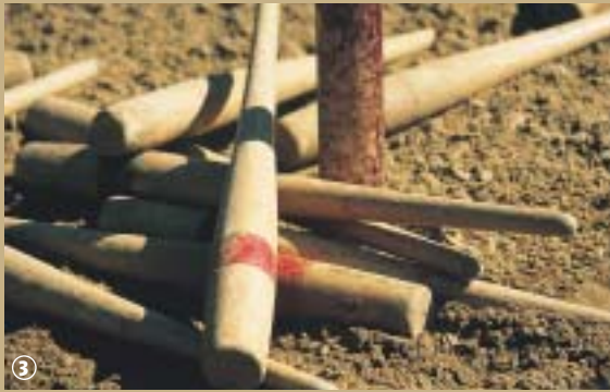
Jeu de Billon.

Ne vous étonnez pas de rencontrer au départ de la randonnée, un groupe d'individus lançant chacun leur tour une sorte de massue en bois, le plus près possible d'un but, pinaillant à qui sera le plus