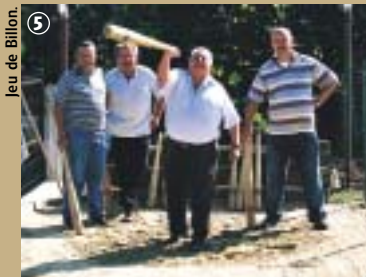
Jeu de Billon.

proche ! Vous longez tout simplement un terrain de billon. C'est un jeu traditionnel, cousin éloigné de la pétanque, très répandu au XIX e siècle en Artois, dans le Cambrésis et le Hainaut, où il prend les noms de bricotiau et de bilbotiau ; il reste aujourd'hui vivant dans le Douaisis et le Cambrésis. La règle générale est de jeter le billon de façon à toucher le piquet de but en fin de course. L'un des deux joueurs de l'équipe adverse doit tenter de déplacer le premier