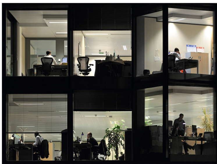
« alvéoles 234 » – lambda sur dibon – 120x120 cm – ed.5

*alvéoles Vol.2' > "alvéoles n°06" > 60 x 80 > ©2009