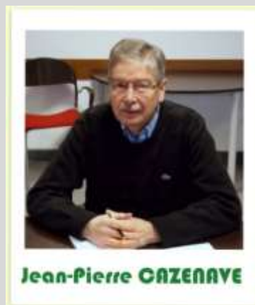
Vice-Président Programmation des activités