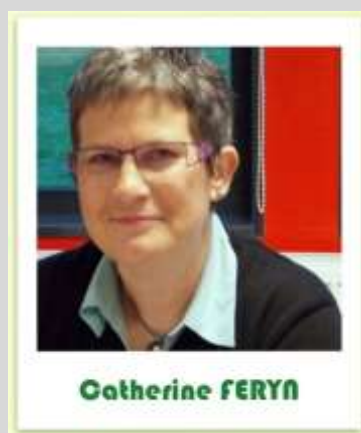
Secrétaire- Photos Communication interne