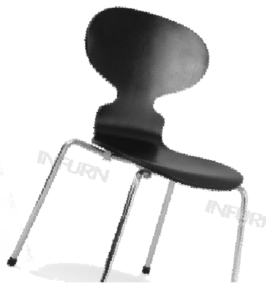
Arne Jacobsen Chaise /1953Fourmi