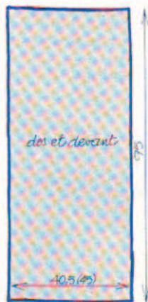
Taille 38 (40/42).

Le dos et le devant sont semblables. Pour chaque morceau, monter 118 (131) m. et tric. au pt de chevrons tout droit. A 95 cm (plus ou moins selon la haut. désirée), rab. Bretelle : monter 7 m. et tric. en côtes 1/1 en biais en commençant celui-ci au 3 e rg. A 35 cm, rab. Faire une 2 e bretelle semblable. Montage : assembler dos et devant en laissant dans le bas la couture ouverte sur 22 cm environ pour les fentes. Doubler les bretelles avec le biais et les fixer à la robe.