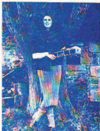
LA PANOPLIE BLEUE