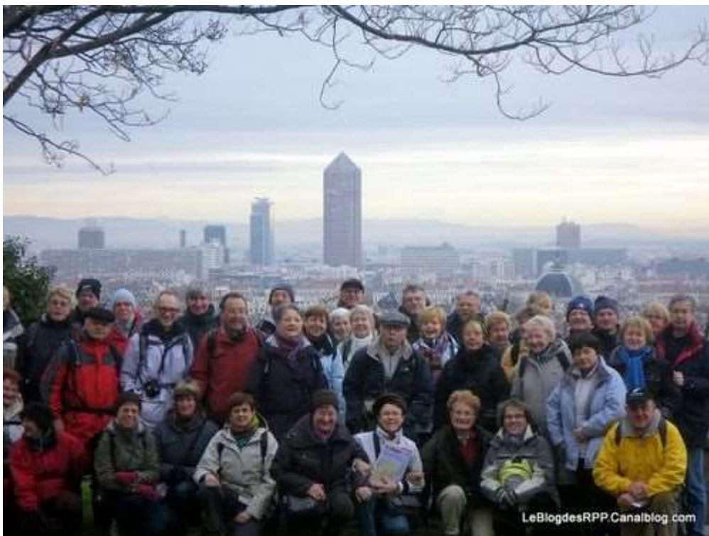
Lyon "ville-lumières" déc. 2009

“ ET QUE VIVENT LES SEJOURS CONVIVIAUX !!!... ”