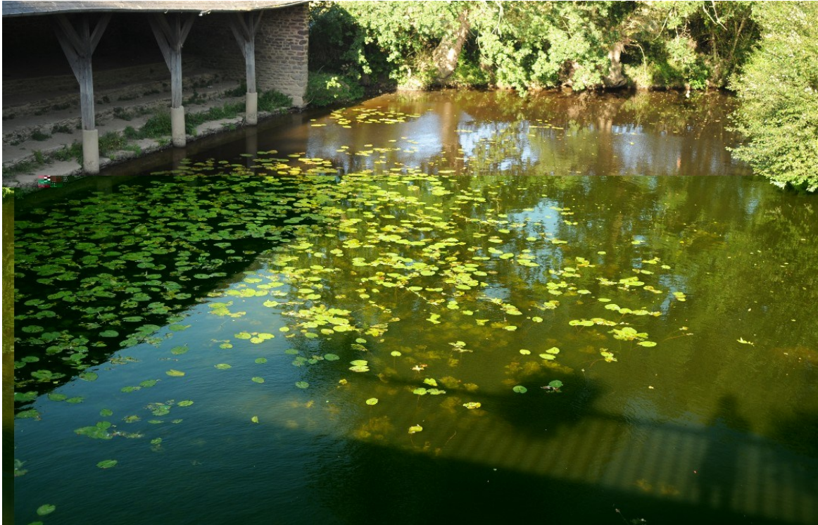
Rivière du Meu, le lavoir. Rive Nord à gauche. Prise de vue depuis le pont