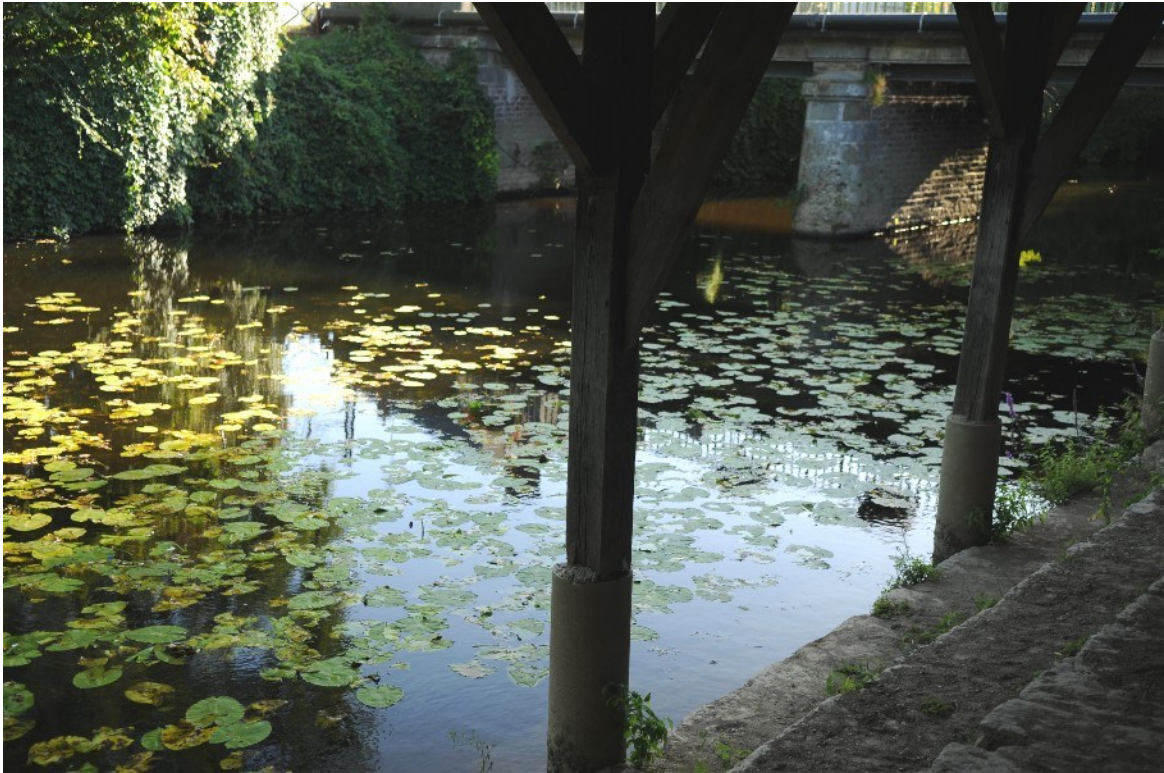
Rivière du Meu, le lavoire. Prise de vue depuis le lavoire. On aperçoit le pont qui enjambe la rivière