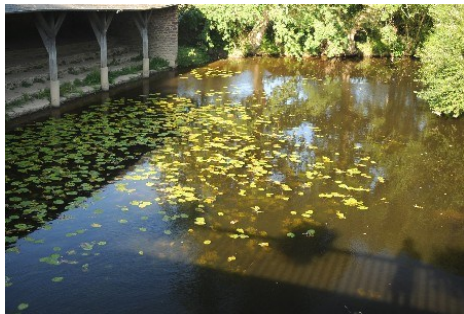
Rivière du Meu, le lavoir