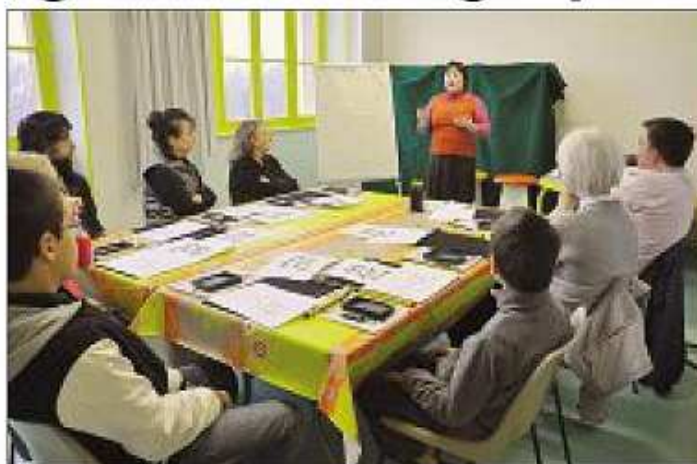
INITIATION. Les participants, passionnés par le Japon, ont suivi avec attention les explications de Maiko.

« Deux syllabaires, hiragana et katakana, et au minimum 2.136 caractères chinois appelés kanji sont nécessaires pour écrire la langue japonaise », a-t-elle